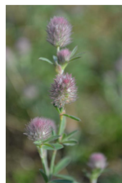
Margerite (Leucanthemum vulgare), Kleiner Wiesenknopf (Sanguisorba minor), Hornklee (Lotus corniculatus), Hasen-Klee (Trifolium arvense)